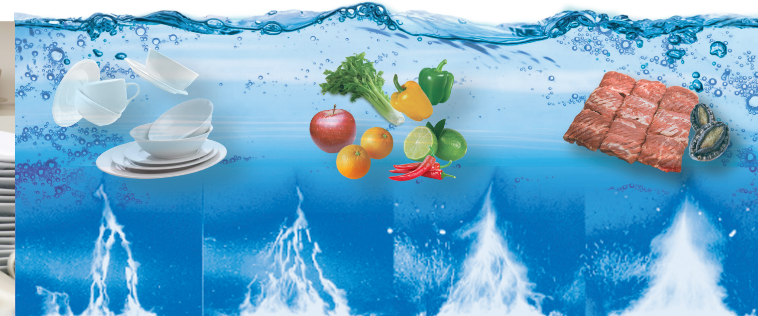
과학적으로 증명된 초음파 원리